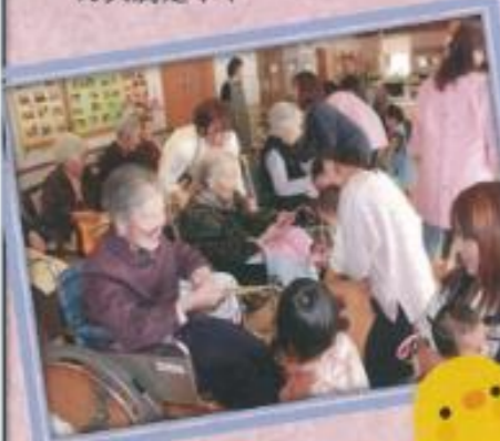
プレゼント交換の様子♪