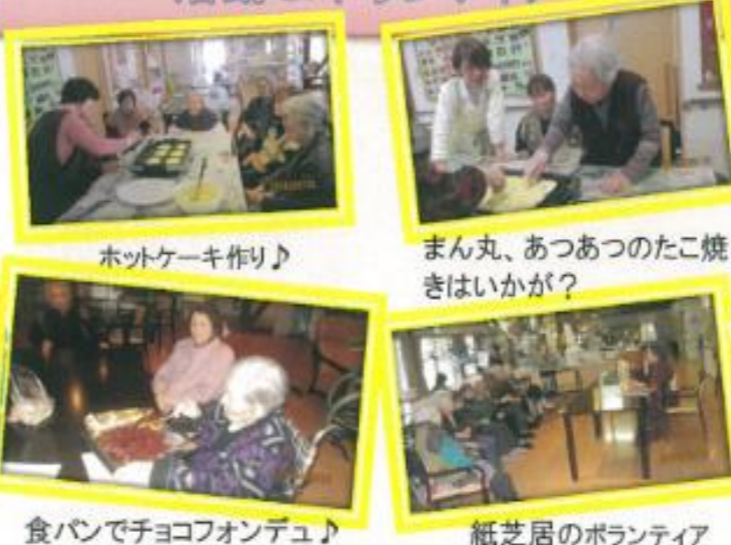
ホットケーキ作り♪