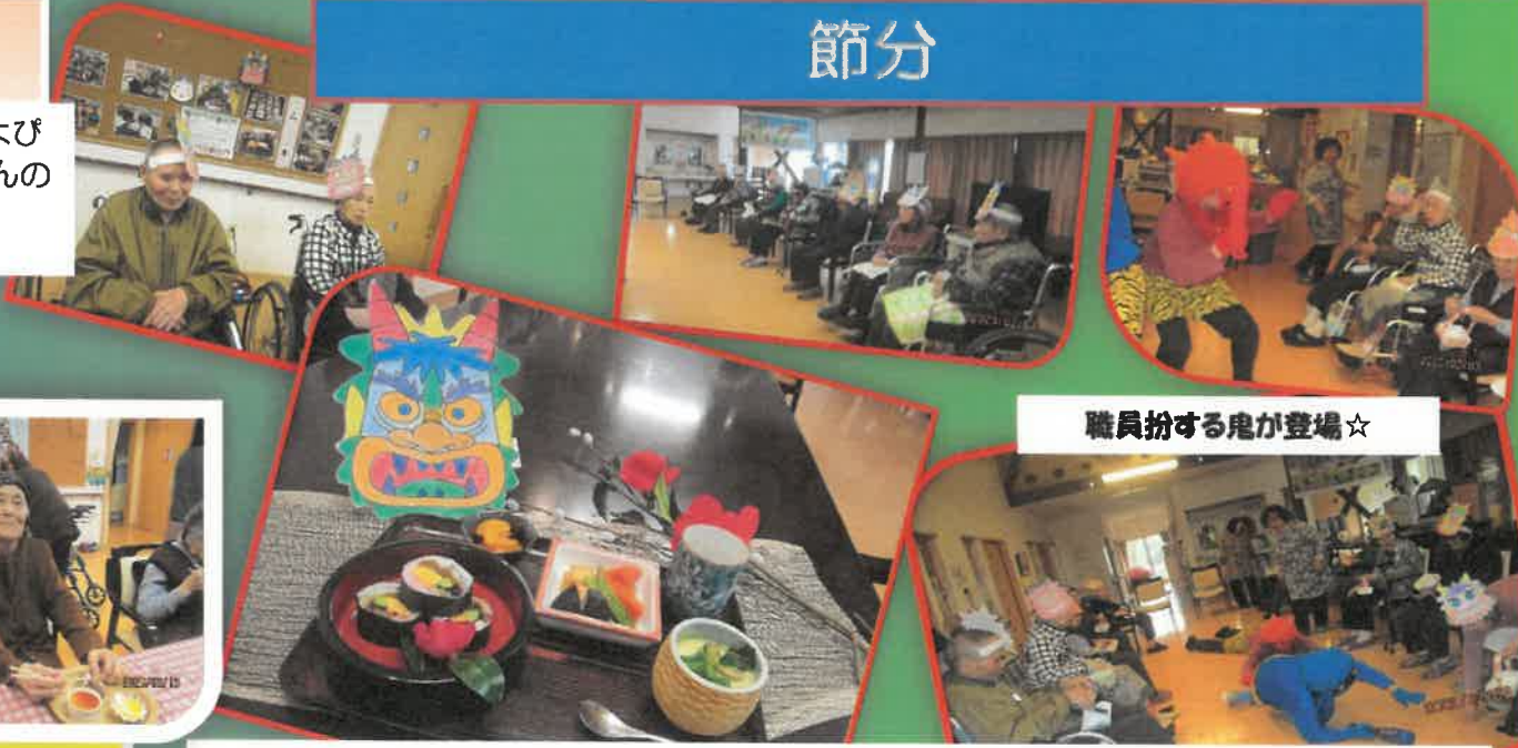
職員扮する鬼が登場☆

2月3日(月) 豆まきを行いました。「鬼は～外！！」「福は～内！！」ホームに大きな声が響きます。節分メニューは、恵方巻・茶碗蒸し・煮物など。今年の恵方は「南南東」。南南東を向いて食べられたかな？きっと、たくさんの福が舞い込むはずです。