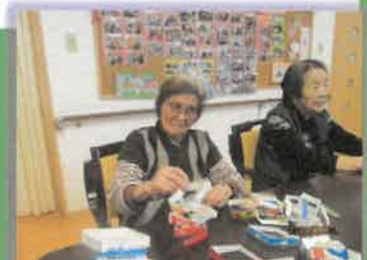
牛乳パックタワー。