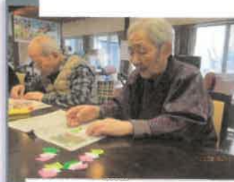
ひな飾りの制作です。