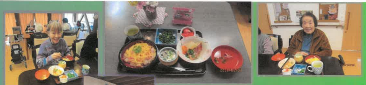
利用者様による詩吟の披露

3月3日はひな祭り。雛祭りの会ではお二人のご利用者が詩吟を披露されました。職員手作りの「雛祭りご膳」。おやつのお酒も職員が作りました。